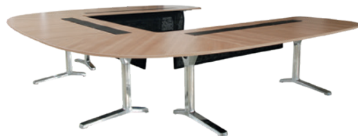
pulse table de conférence

A-4950 Altheim Linzer Strasse 22 T +43 (7723) 460-0 altheim@wiesner-hager.com